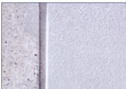
Vorher Nachher Beschichtete Fläche mit Kopfrollung und Fugenverguss