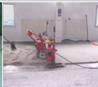
Laserunterstützter Einbau von Epoxidharz-Estrichen