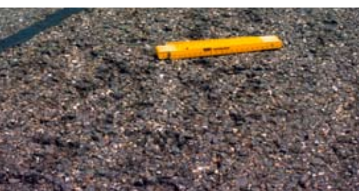
Typisches Bild eines schadhaften Asphaltbelags