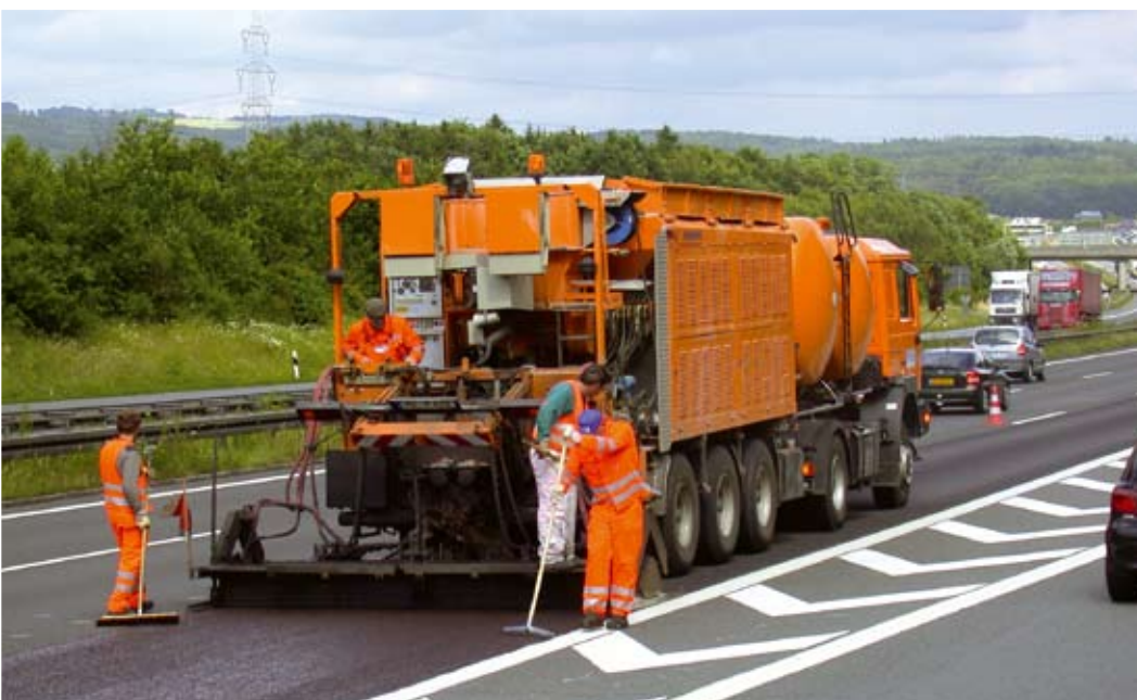
Einbau eines DSK-Belags

Gemäß der TL BEA-StB werden Eigenüberwachungen im Sinne der WPK im POSSEHL Zentrallabor (Anerkennung nach RAP Stra) kontinuierlich durchgeführt.