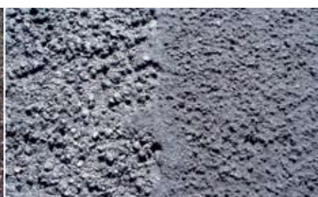
Texturen von DSK 8 und DSK 5 nach dem Einbau