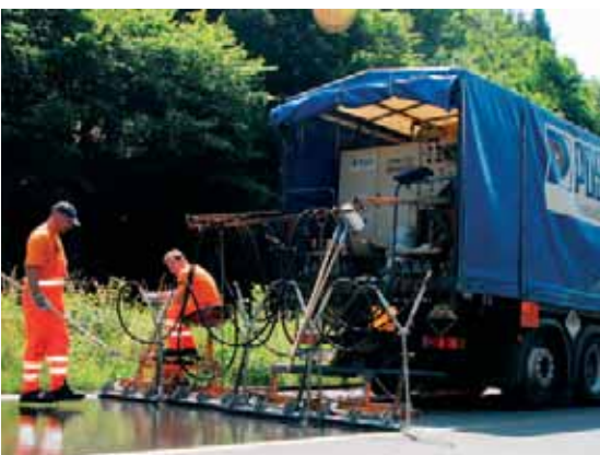
Das Bindemittel wird über Kämme auf die vorbereitete Fahrbahn oder Flugbetriebsfläche aufgetragen.

Die Wahl der passenden Gesteinskörnung hängt von der gewünschten Textur und der künftigen Aufgabenstellung der zu behandelnden Oberfläche ab. Bei der Frage, welche Körnung die Anforderungen im konkreten Anwendungsfall am besten erfüllt, beraten wir Sie gerne.