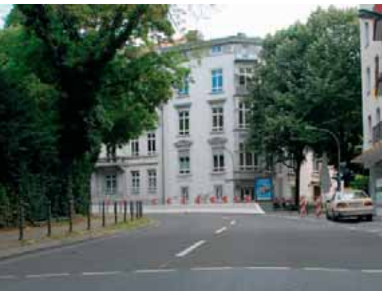
EP-GRIP auch für sichere Stadtstraßen: In dieser Kurve ereigneten sich jedes Jahr zahlreiche Unfälle. Der Unfallschwerpunkt in der City von Frankfurt/M. wurde mit EP-GRIP erfolgreich entschärft.

Messungen mit dem Seitenkraftmessverfahren (SKM) ergaben auf Bundesautobahnen Kraftschlussbeiwerte von \mu \geq 0,7 bei 80 km/h Messgeschwindigkeit und bei 40 km/h im Bereich von Beschleunigungs- und Verzögerungsspuren, Schleifen und Tangenten.