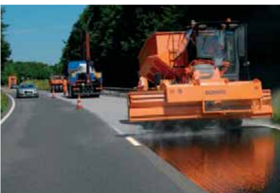
EP-GRIP wird parallel zum fließenden Verkehr aufgebracht. Das Bindemittel bindet die gestreuten Gesteinskörnungen sofort. Die Körner verwirbeln auch dann nicht, wenn LKW die Baustelle passieren

Für den Einsatz auf Asphalt wurde ein spezielles Bindemittel entwickelt, das über eine an Asphalt angepasste Flexibilität verfügt. Diese Bindemittelschicht kann Temperaturschwankungen und die damit verbundenen Dehnungen der darunter liegenden Fahrbahn kompensieren, ohne Schaden zu nehmen oder an Festigkeit zu verlieren. Deshalb hält dieses Belagssystem den Belastungen des Verkehrs nachweislich über viele Jahre stand.